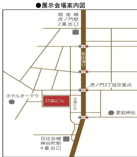
● 日比谷線神谷町駅 4番出口より徒歩5分 ● 銀座線虎ノ門駅 2番出口より徒歩7分